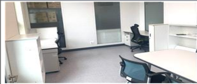
스타트업 포레(개별형) 5평형