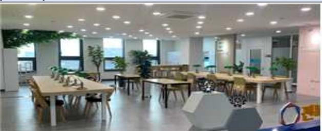
스타트업 포레 라운지(개방형)