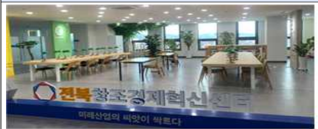
스타트업 포레 라운지(개방형)