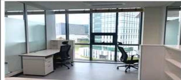
스타트업 포레(개별형) 6평형