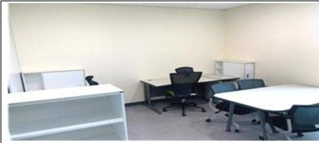
스타트업 포레(개별형) 4평형