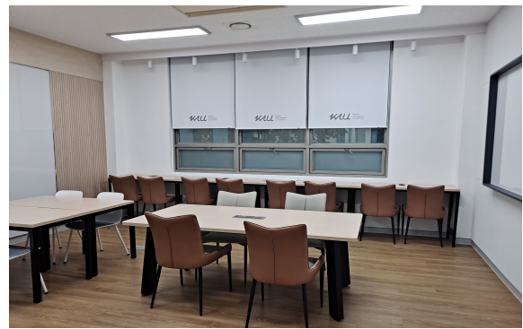
창의혁신공간 Open Space (휴게·회의·네트워킹 공간)