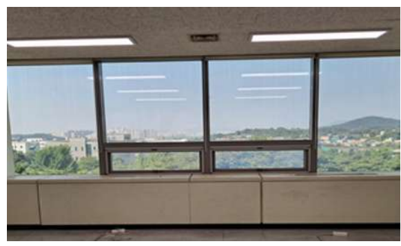
입주실 개별 사무공간 2