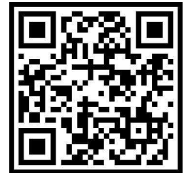
사전설명회 참가 신청 QR