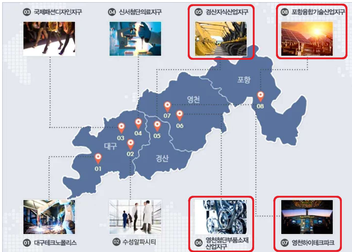
<경제자유구역(경북지구) 4개 지구 위치도>