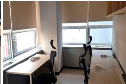
보육공간(10실), 교육장, 네트워킹 라운지, 콜라보룸, 회의실, 탕비실 등 보유