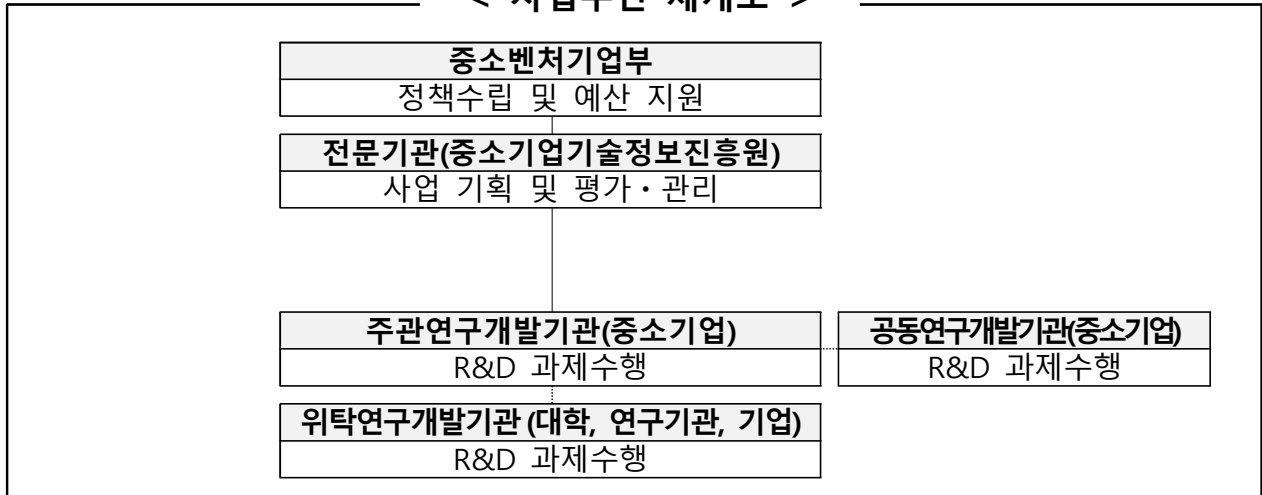
< 사업추진 체계도 >