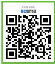
※ 회원가입 QR코드

- 통합플랫폼을 통해 회원가입 후 신청하거나, 원주지점에 전화하여 직접 상담예약 신청 후 방문