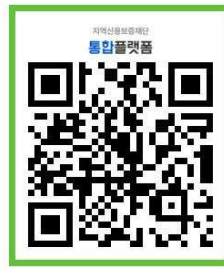
※ 보증신청 QR코드