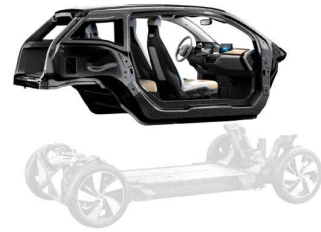
<경량 차량 외장재>