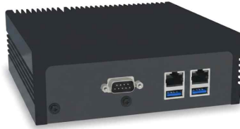
<주변 감지 엣지AI 디바이스>