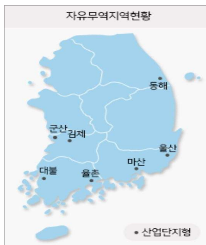
< 자유무역지역별 권역 분류 >

－ (FTZ 맞춤형 교육운영) 산업형 7개 자유무역지역 대상 맞춤형 교육 커리큘럼 수립 및 교육 운영이 가능한 기관 등