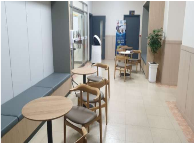
대전센터 내부 라운지