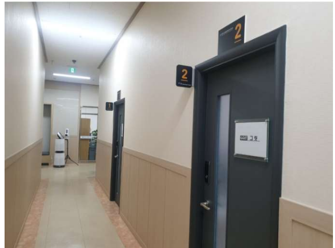
대전센터 복도 및 보육실 입구