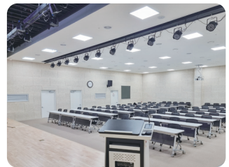
대회의실 수용인원 100명