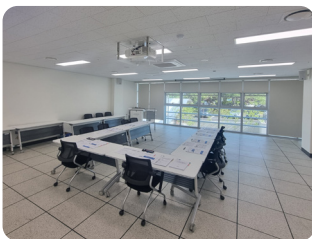
교육실 수용인원 30명