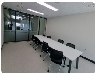
3층 회의실 6~10명