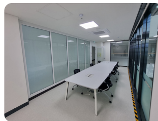
2층 회의실 6~10명