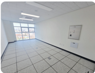
입주시설 전용면적 10평