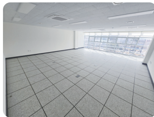
입주시설 전용면적 20평