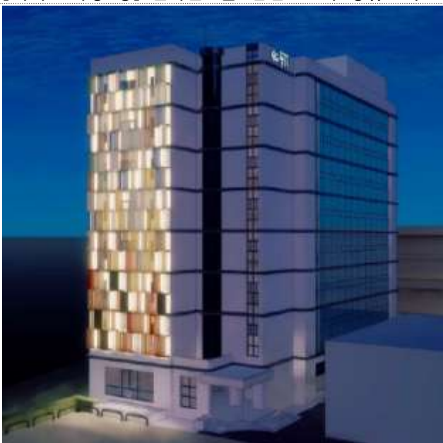
경기도 사회혁신공간 팔로우 외관