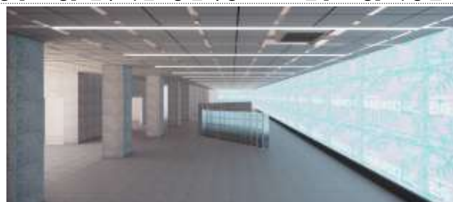
[1층] 사회혁신 체험 및 홍보공간