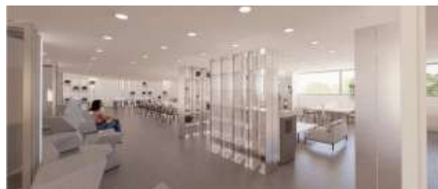
[2층] 사회혁신 협업 공간(공유오피스 등)