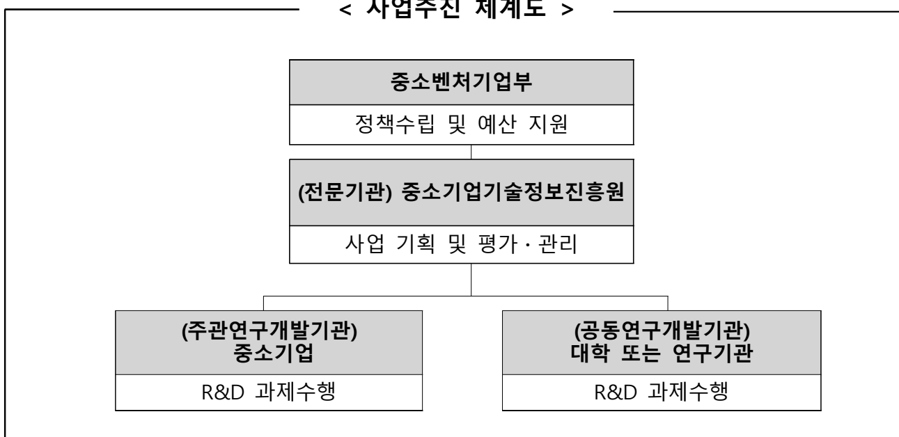
< 사업추진 체계도 >