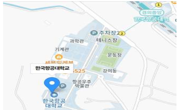
보육센터 위치 (경의중앙선 한국항공대역 2번 출구)