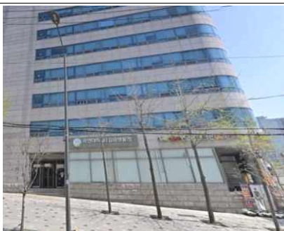
국민대학교 창업보육센터 전경