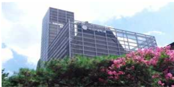
국민대학교 제로원디자인센터 전경