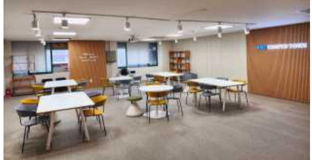
제로원디자인센터 3층 오픈스페이스