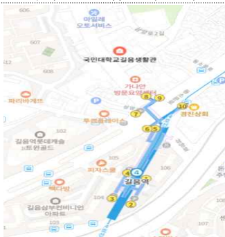
국민대 창업보육센터 위치