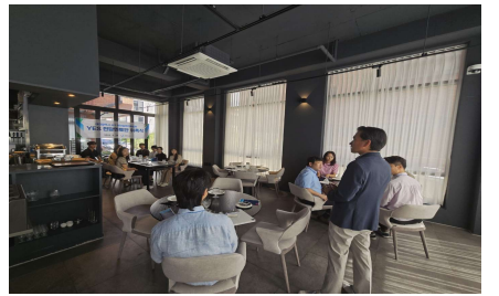
매월 정기 네트워킹 프로그램 개최