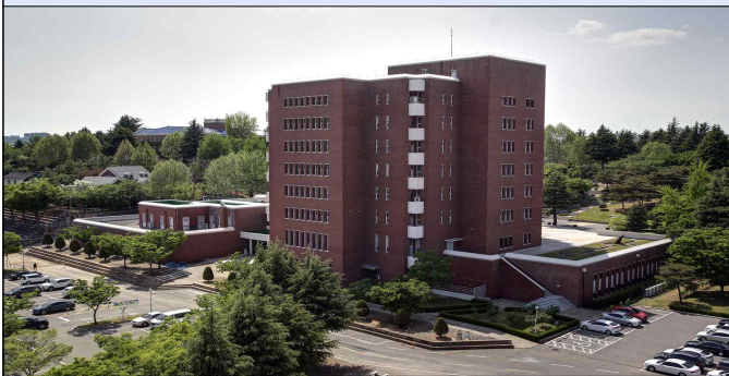
동산관 4층, 5층