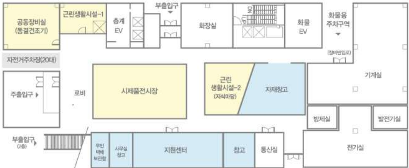
[1층 HALL / 시제품 전시장]