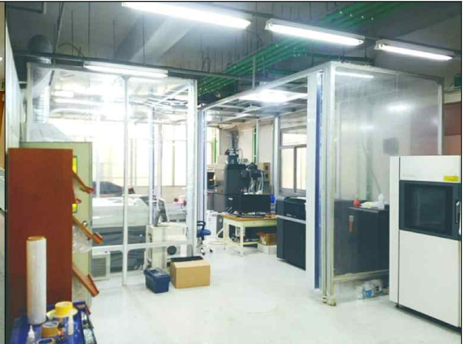
로봇공동연구센터 장비 이용(401동)