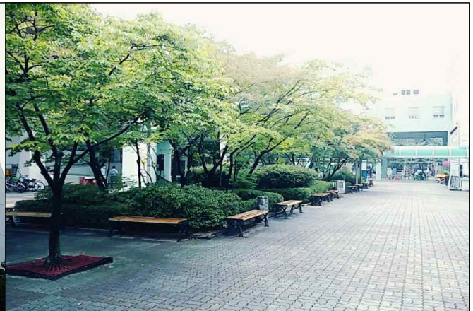
부천테크노파크 2단지 전경