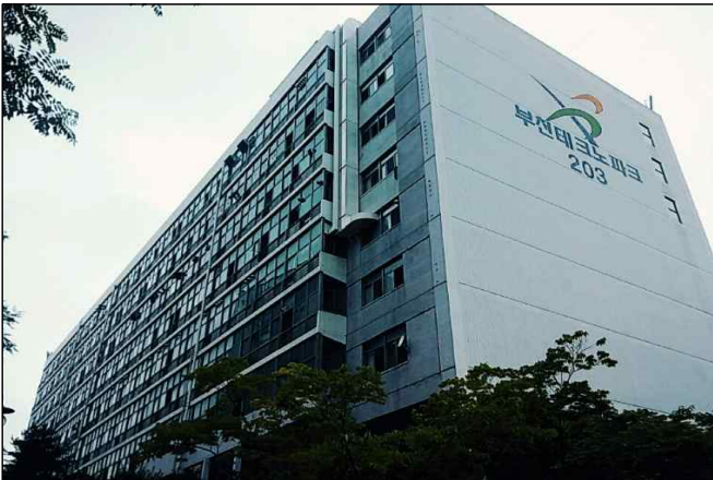
부천테크노파크 2단지 전경