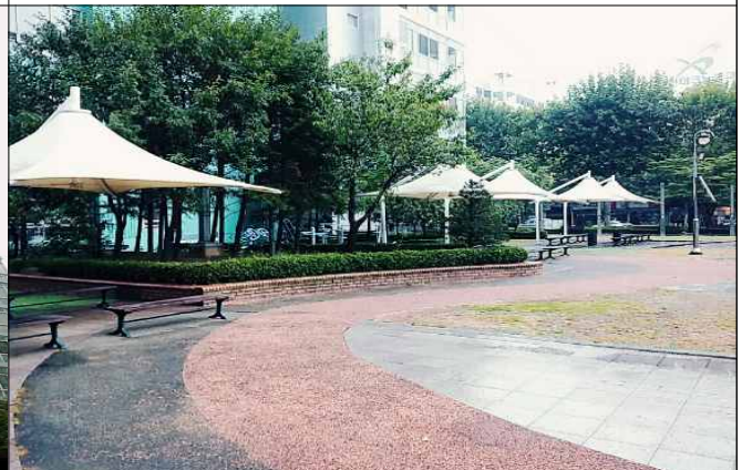
부천테크노파크 401동 전경