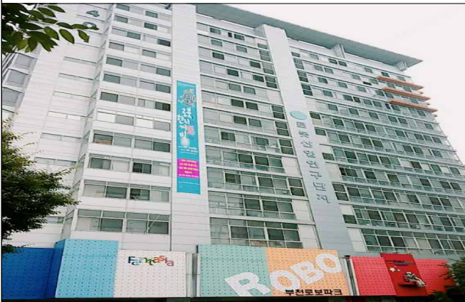
부천테크노파크 401동 전경