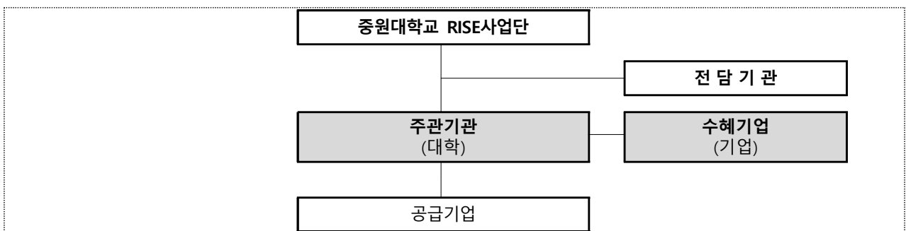
< 충북 인공지능(AI)·모빌리티 시제품제작지원 기관 수행 체계 >