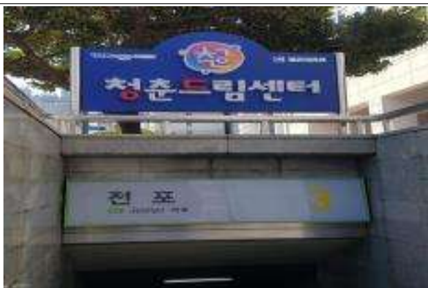
전포역 지하철 3번 출구