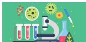
1인 창조기업 활성화 지원사업