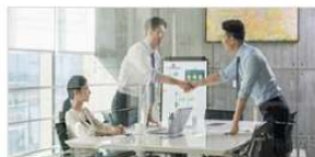
K-콘텐츠 청년창업 지원사업