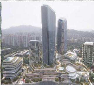
The-K호텔 재개발(예정) 4차산업 중심 R&D 및 지원 시설 조성 2025년 착공 목표