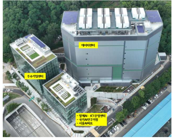
- 시설 전경 -