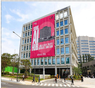
서울AI허브(2017~) (메인센터, 한국교총, 하이브랜드, 희경빌딩)