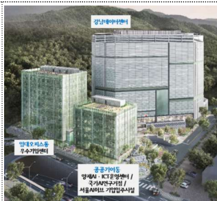
강남데이터센터(2025.6~) (입주예정 : 우수기업센터, 양재 AI·ICT운영센터, 국가SI연구거점, 서울AI허브)