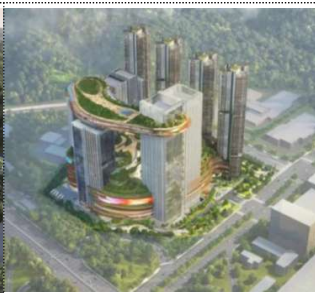
도시첨단물류단지(예정) R&D 중심 '스마트&그린 콤팩트시티, 2025~2030)