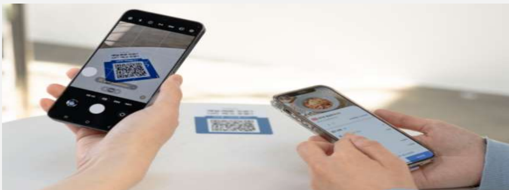
[테이블 부착형 QR 메뉴판 예시 이미지]