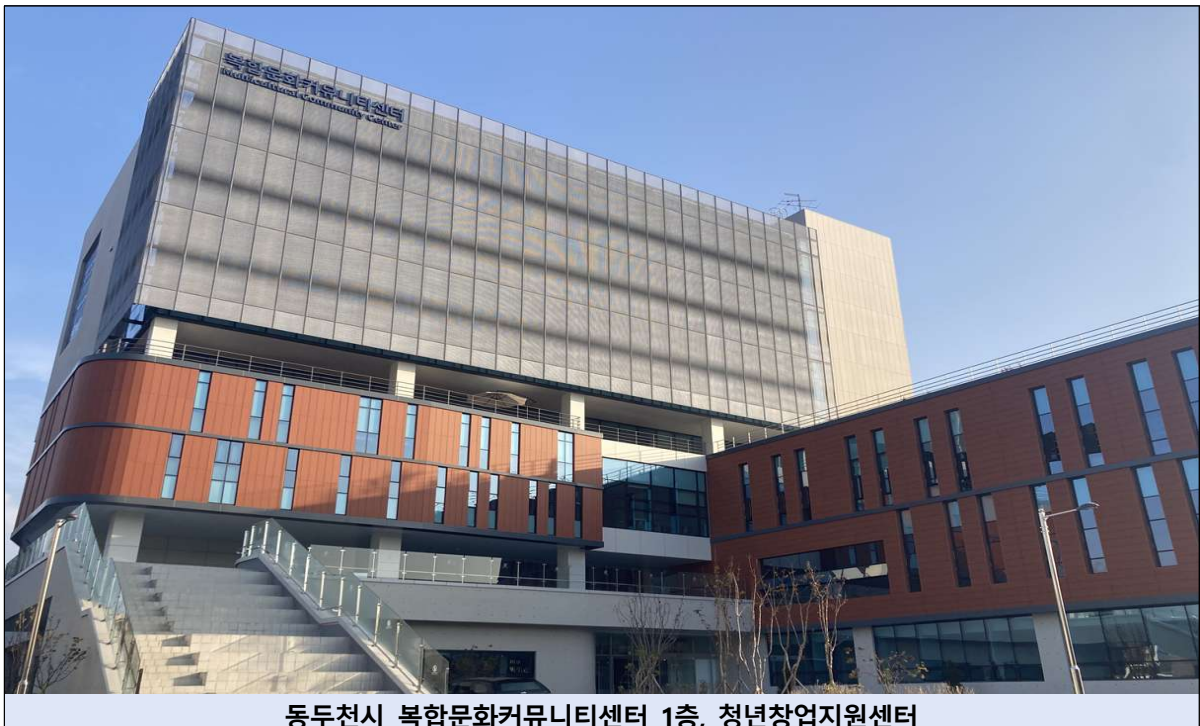
동두천시 복합문화커뮤니티센터 1층, 청년창업지원센터