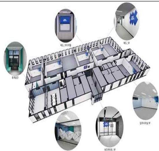
(9F) 입주지원실 및 교육실·회의실