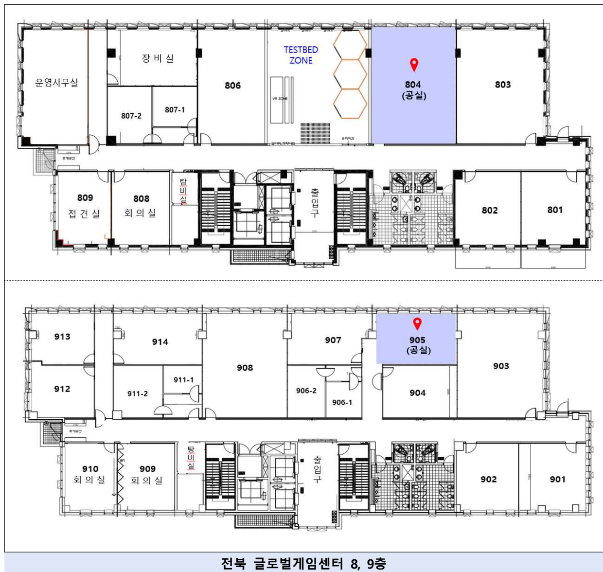
전북 글로벌게임센터 8, 9층