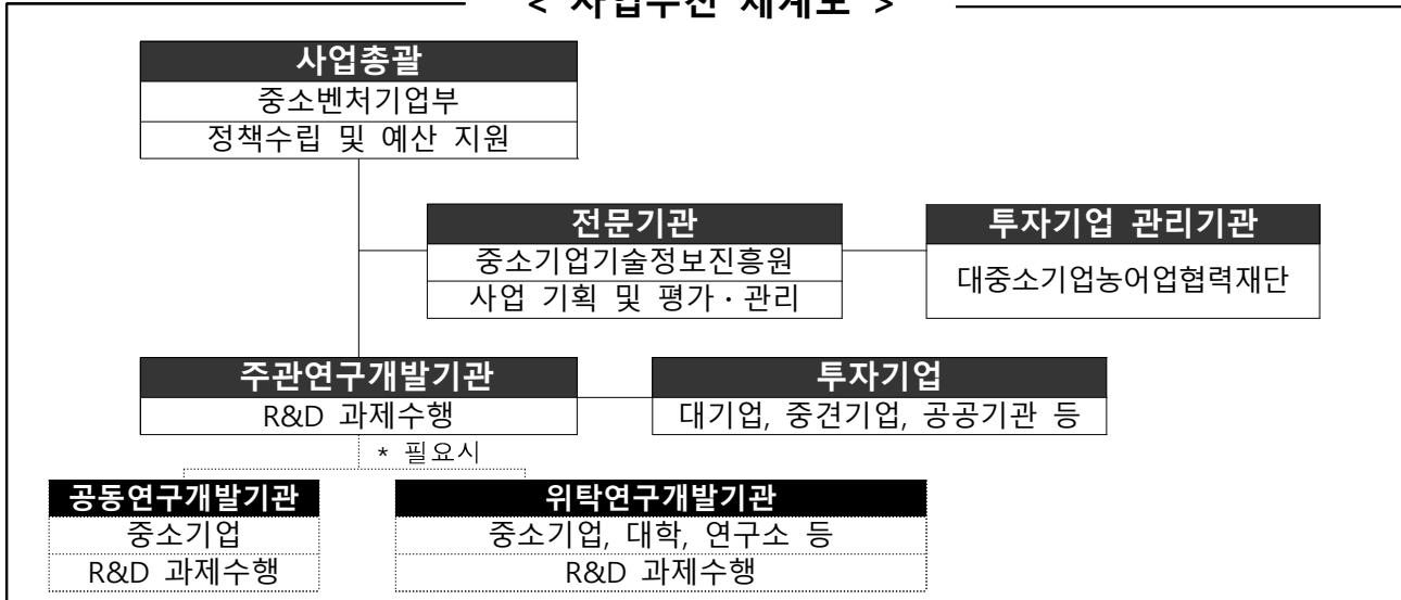
< 사업추진 체계도 >