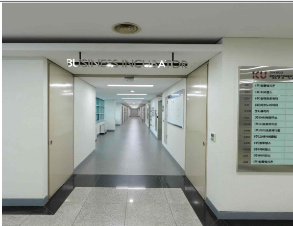
R&D센터 6층 A라인 입구