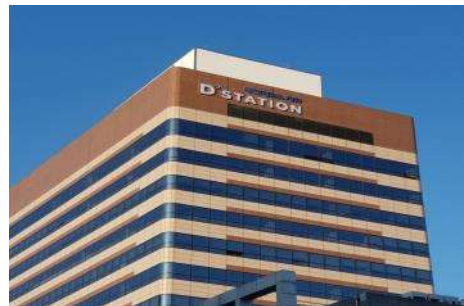
초기투자엑셀러레이터협회 대전 교육원