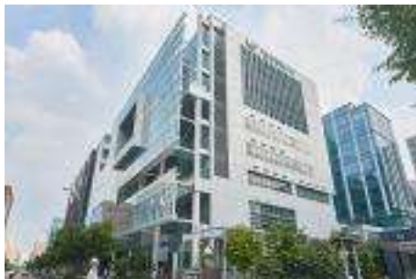
초기투자엑셀러레이터협회 서울 본원