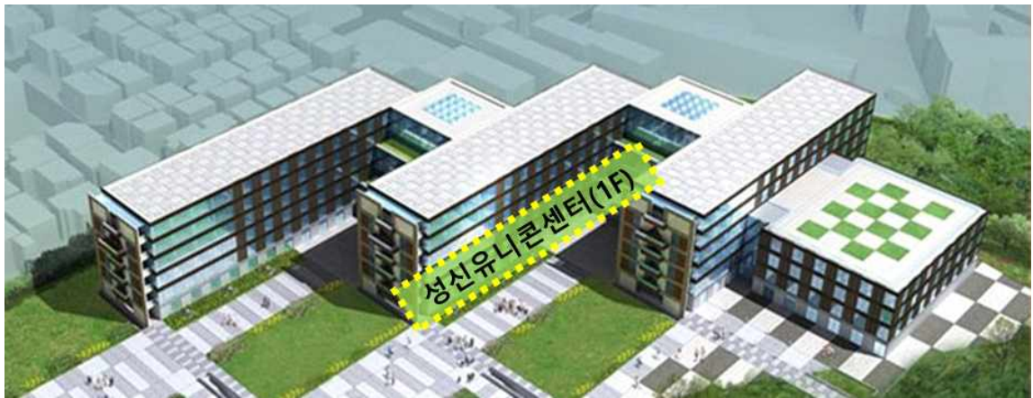
B동 1층 성신유니콘 센터 전체 도면