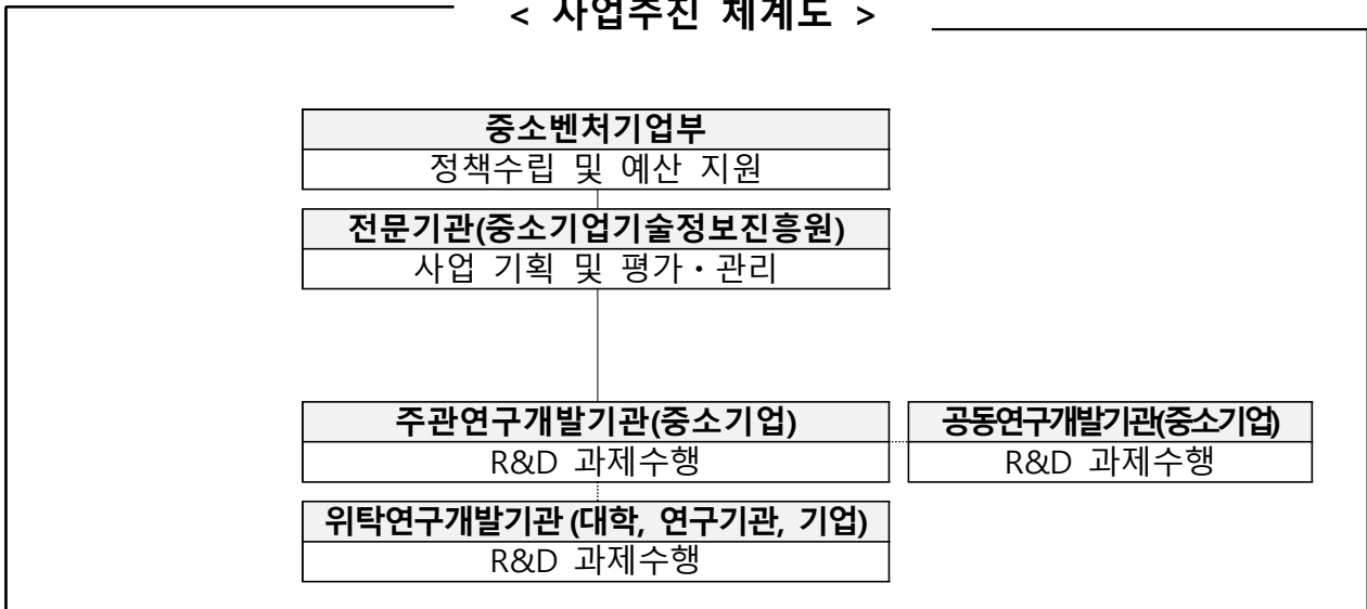
< 사업추진 체계도 >