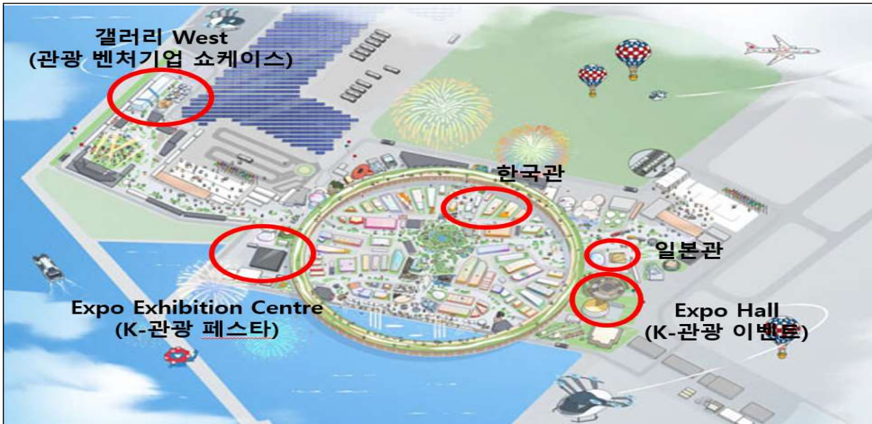
엑스포 부지 내 이벤트 행사장 위치도