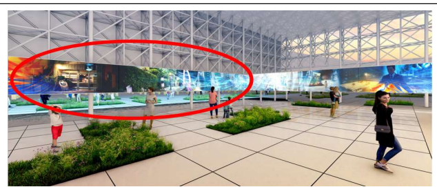
한국관 미디어 파사드(외부 1면, 내부 1면)