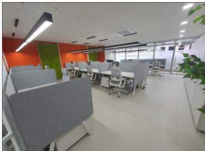
중장년 기술창업센터 (하이테크밸리)