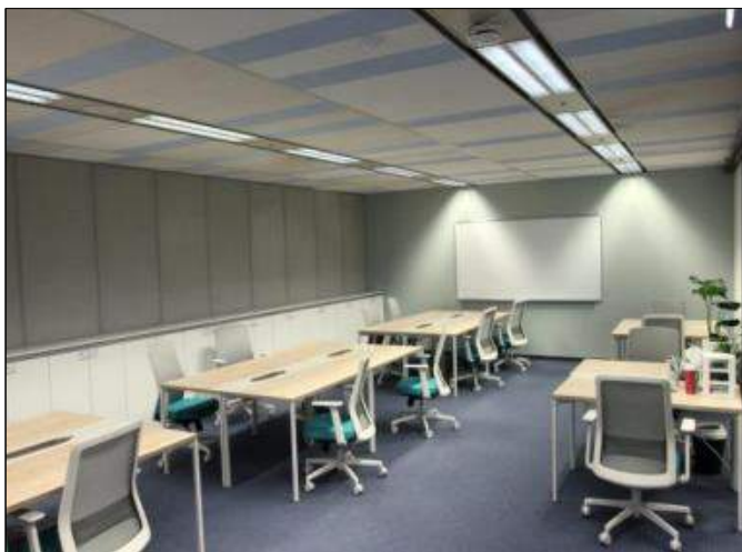
중장년 기술창업센터 (킨스타워)