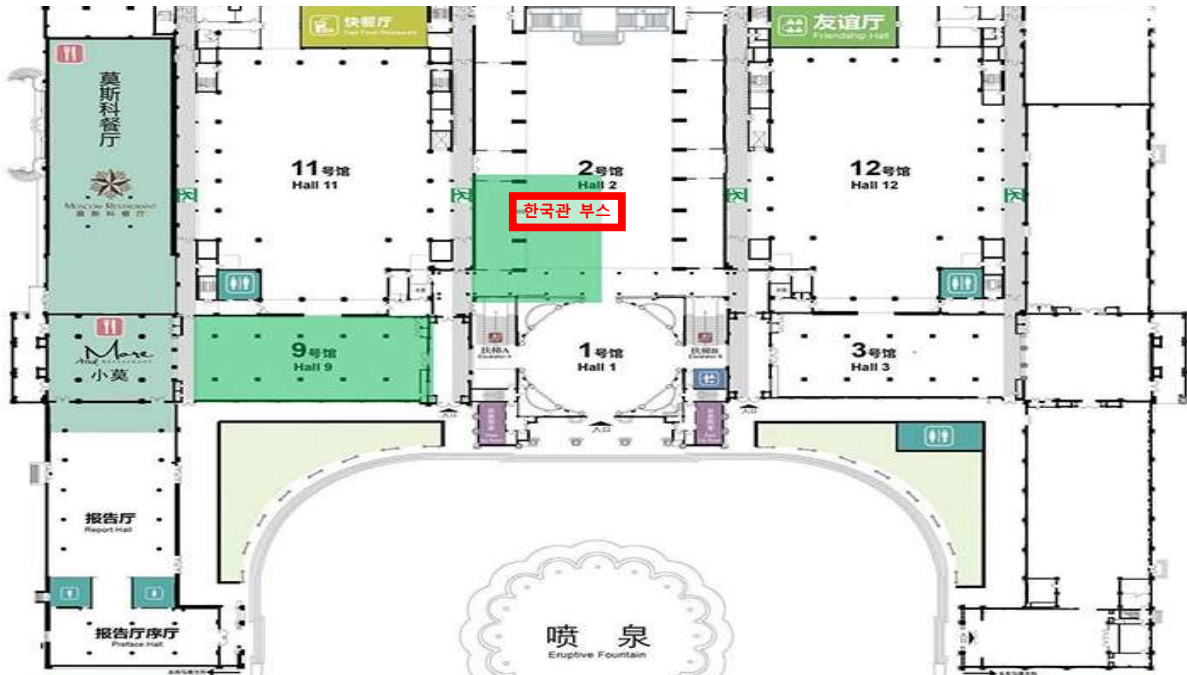
▲ 전시장 전체 평면도