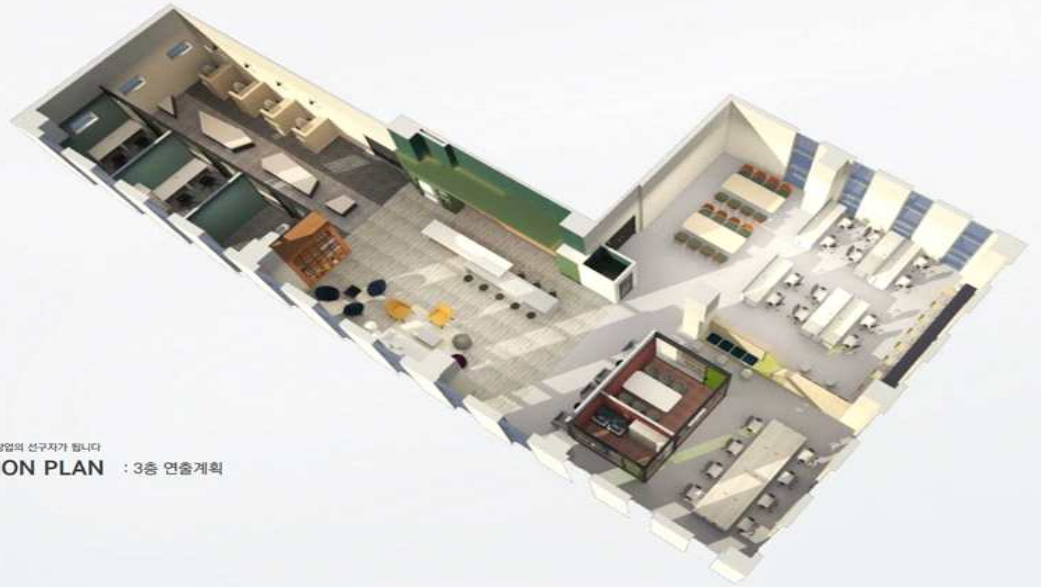
< 경남청년창업지원센터 3층 입주공간 >